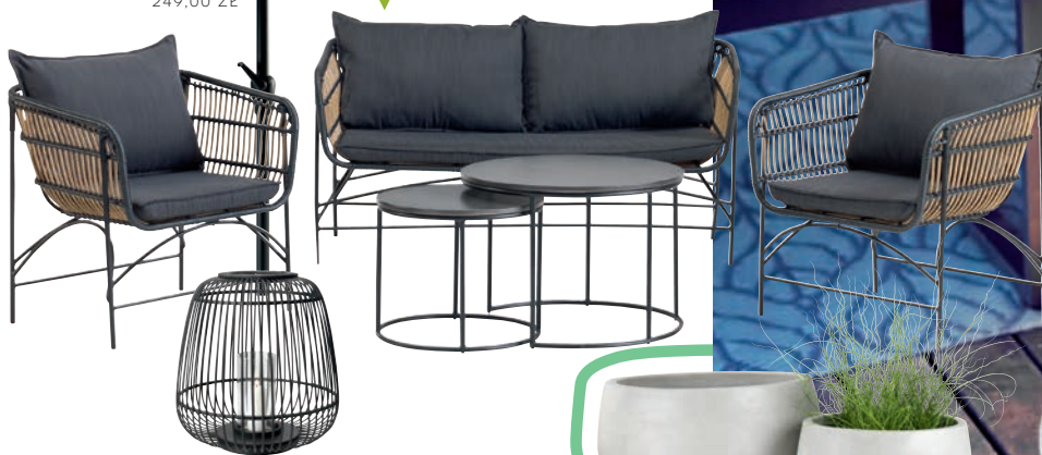
▲ LATARNIA - JYSK