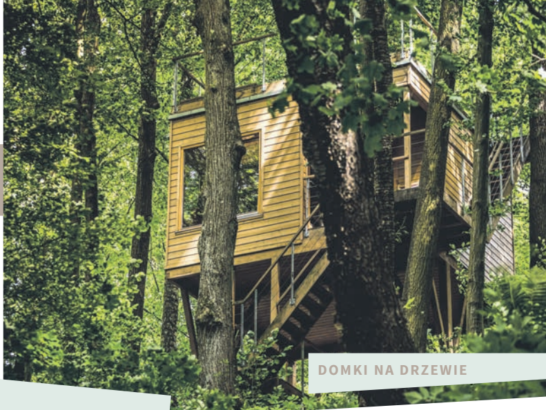
DOMKI NA DRZEWIE