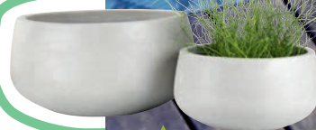
▲ DONICA OGRODOWA - JYSK