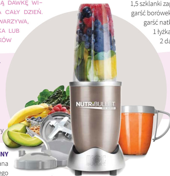
EKSTRAKTOR NUTRIBULLET - MANGO

2 mango 1 limonka 1 papaja 1 pomarańcza 10 listków świeżej mięty