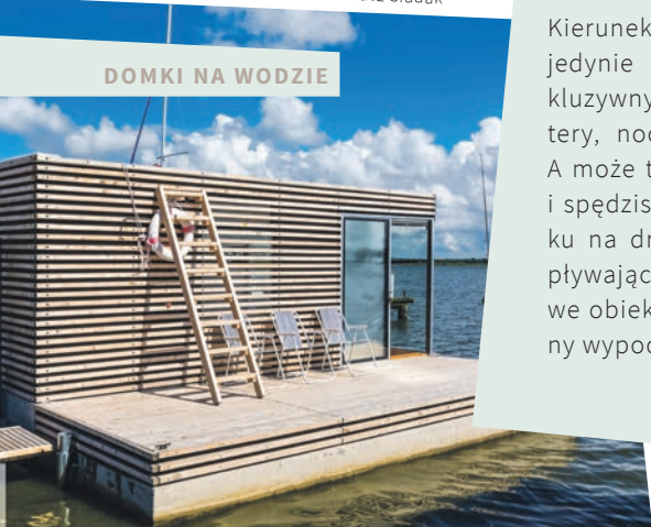
DOMKI NA WODZIE

Kierunek wakacji obrany, pozostaje jedynie zarezerwować nocleg. Ekskluzywny hotel SPA, prywatne kwatery, nocleg na polu namiotowym. A może tym razem zerwiesz z rutyną i spędzisz noc w klimatycznym domku na drzewie, bajkowej chatce lub pływającym apartamencie? Nietypowe obiekty gwarantują niezapomniany wypoczynek.