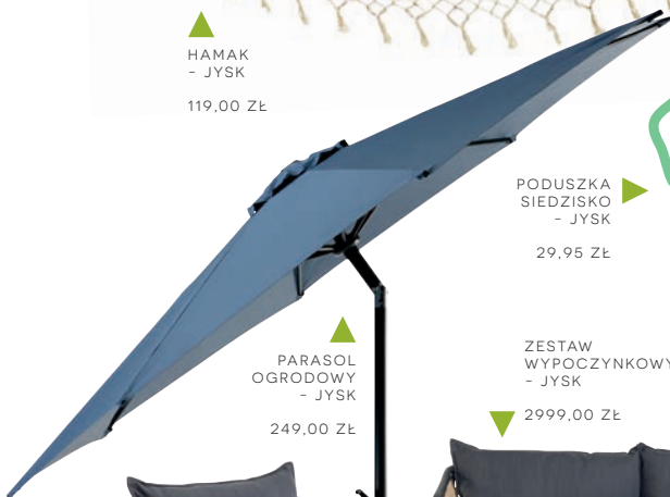
▲ PARASOL OGRODOWY - JYSK