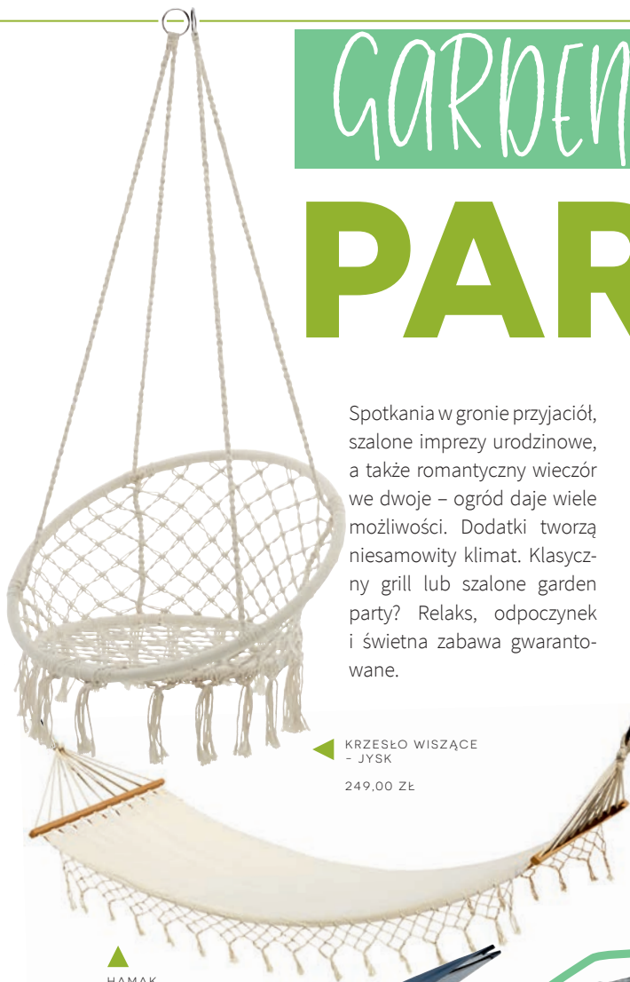
▲ KRZEŚŁO WISZĄCE - JYSK

Spotkania w gronie przyjaciół, szalone imprezy urodzinowe, a także romantyczny wieczór we dwoje – ogród daje wiele możliwości. Dodatki tworzą niesamowity klimat. Klasyczny grill lub szalone garden party? Relaks, odpoczynek i świetna zabawa gwarantowane.